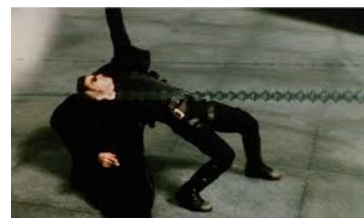
Кадр із фільму «Матриця»

ковбоїв); екшен — «фільм дії», високобюджетний бойовик з каскадерськими трюками; містика, історичні, зокрема військові фільми. Крім згаданих уже комедій і мелодрами, до жанрів літературно-театрального походження належить фільм-казка. Позначення жанру як «музична комедія» зазвичай застосовують до екранного продукту, сценічним прототипом якого була оперета. Мюзикл також було перенесено на кіноекран з театральних підмоств. Ці музично-сценічні жанри містять багато пісень і танців, адже саме через зміст вокальних і хореографічних номерів розвивається сюжет.