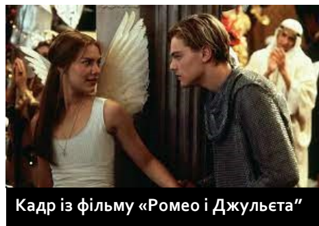
Кадр із фільму «Ромео і Джульєта»

“Кіножанри не мають чітких меж, вони взаємопроникають”