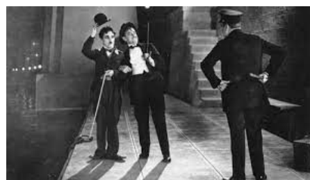
Кадр із фільму «Вогні великого міста»

стрія— галузь економіки, яка виробляє фільми, спецефекти для них, мультиплікацію.